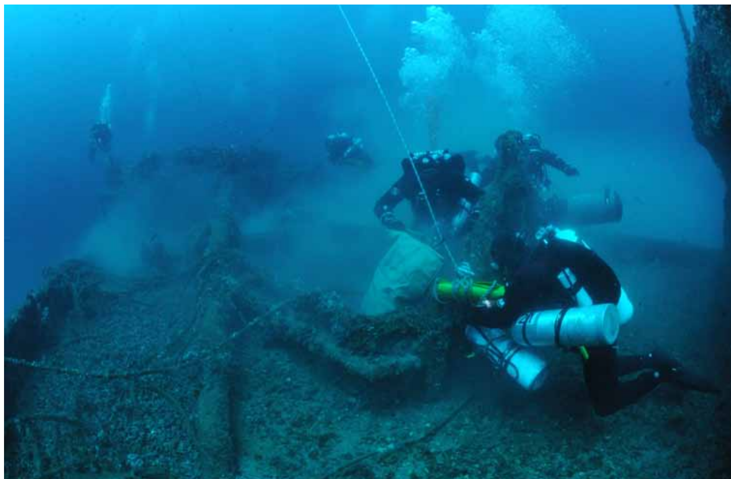
De Argo ligt op 42 tot 50 meter. De duikers hebben decostages bij zich voor de opstijging.