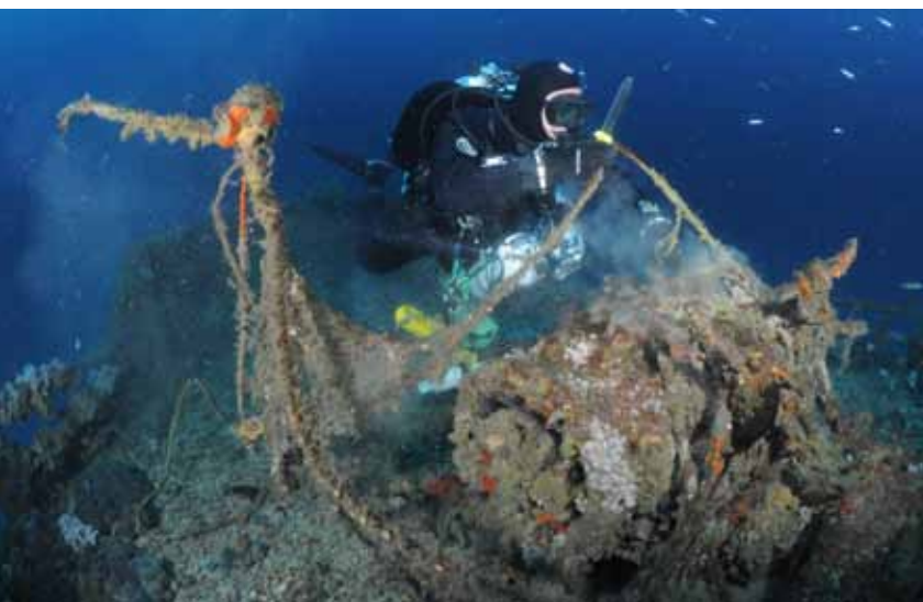
De laatste kabels worden van het wrak gehaald. Het Argo-team bekijkt in de haven de verwijderde netten en kreeftenkooien.