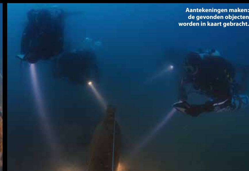
Aantekeningen maken: de gevonden objecten worden in kaart gebracht.