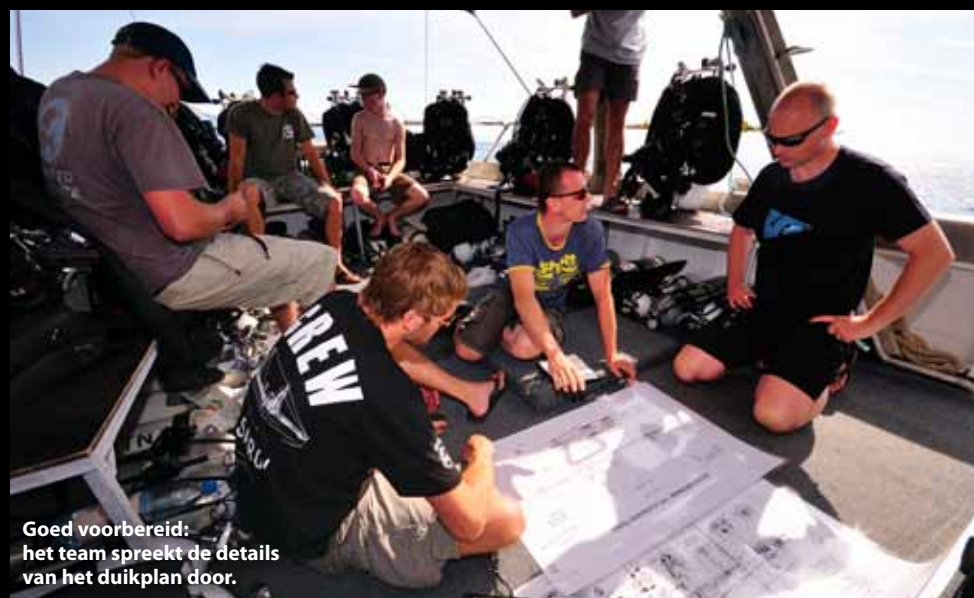
Goed voorbereid: het team spreekt de details van het duikplan door.