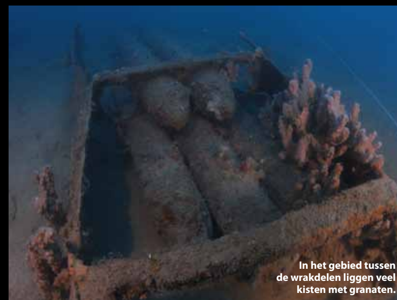
In het gebied tussen de wrakdelen liggen veel kisten met granaten.

Om de Cesare Rossarol voor de toekomst te beschermen willen we de huidige staat van het wrak in kaart brengen. In eerste instantie de basis, waar we op een later moment alle details aan toe kunnen voegen. Omdat de Rossarol in twee delen is gebroken - die 300 meter uit elkaar liggen