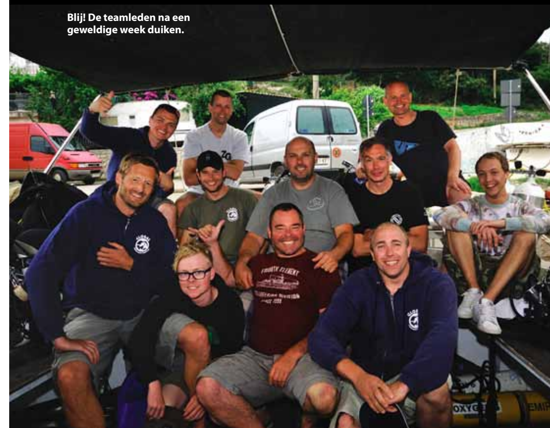
Blij! De teamleden na een geweldige week duiken.

van de Rossarol! Deze steekt machtig uit het zand, een meter of 10 voor ons! Wat een waanzinnig gezicht en fantastisch gevoel geeft dat. We hebben gewoon de verbinding gemaakt van de achtersteven naar de boeg! Ik zie ook bij mijn buddy's de opwinding, maar we moeten toch verder met de opstijging. We zwemmen naar de shotlijn en vervolgen onze weg omhoog. Een enorm mooie afsluiter!