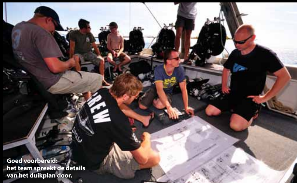
Goed voorbereid: het team spreekt de details van het duikplan door.

bijna onmogelijke opgave. Slechts enkelen weten zichzelf te redden. De achtersteven en het boegdeel komen uiteindelijk 300 meter uit elkaar te liggen op de bodem van de Adriatische Zee. Het verlies van de Cesare Rossarol is vrijwel zeker één van de grootste verliezen van de Italiaanse Marine. Al sinds de zomer van 2013 lopen we rond met het idee om iets te gaan doen met het wrak van de Cesare Rossarol. Alles is begonnen tijdens een gezellige exploratieweek in augustus 2013 georganiseerd door Maurizio Grbac van Krnica Dive in Kroatië. Het wrak van de kruiser ligt in relatief ondiep water tussen de 45 en 50 meter. Doordat het wrak regelmatig bezocht wordt vanuit Krnica is het gelukt het redelijk te beschermen tegen wrakrovers, iets wat niet gelukt is met veel