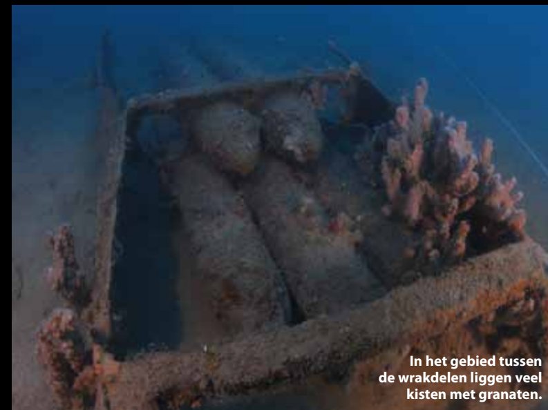
In het gebied tussen de wrakdelen liggen veel kisten met granaten.